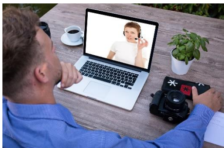
Formação à medida