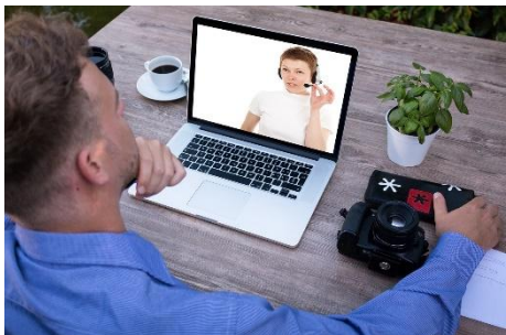
Formação à medida