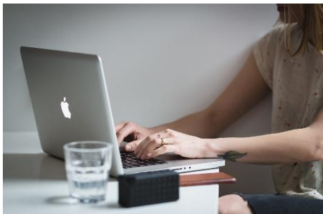
Formação one to one